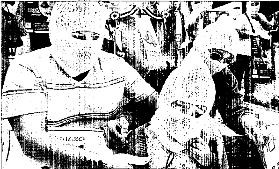
Enfermos de sida protestan por el desabasto de medicamentos; imagen de archivo